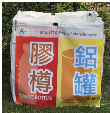
附圖二 回收桶樣式